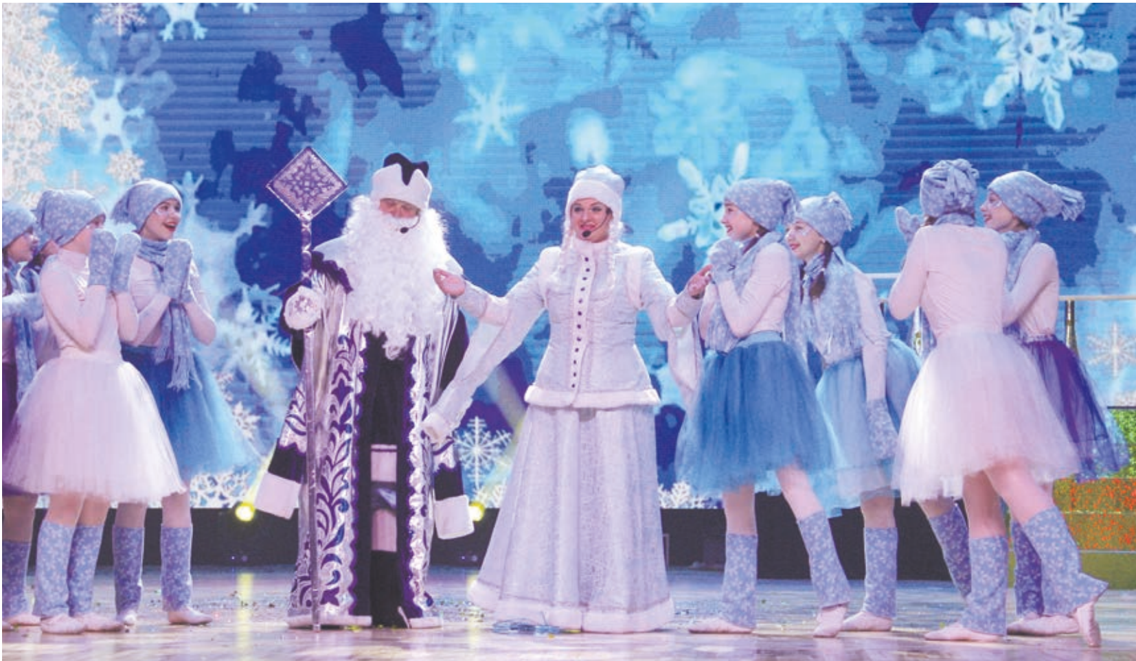
Финал областного конкурса «Лучший Дед Мороз Кузбасса-2021»