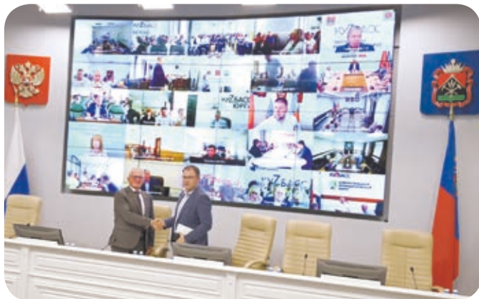
Встреча завершилась рукопожатием лидеров – традиционным символом социального партнёрства

Он кратко рассказал о работе профсоюзов региона в сфере правозащитной работы, охраны труда, заключении коллективных договоров и соглашений. На повестке дня подготовка проекта Кузбасского регионального соглашения, в котором размер минимальной зарплаты вперёд будет привязан не к прожиточному минимуму региона, а к федеральному МРОТ с повышающим коэффициентом.